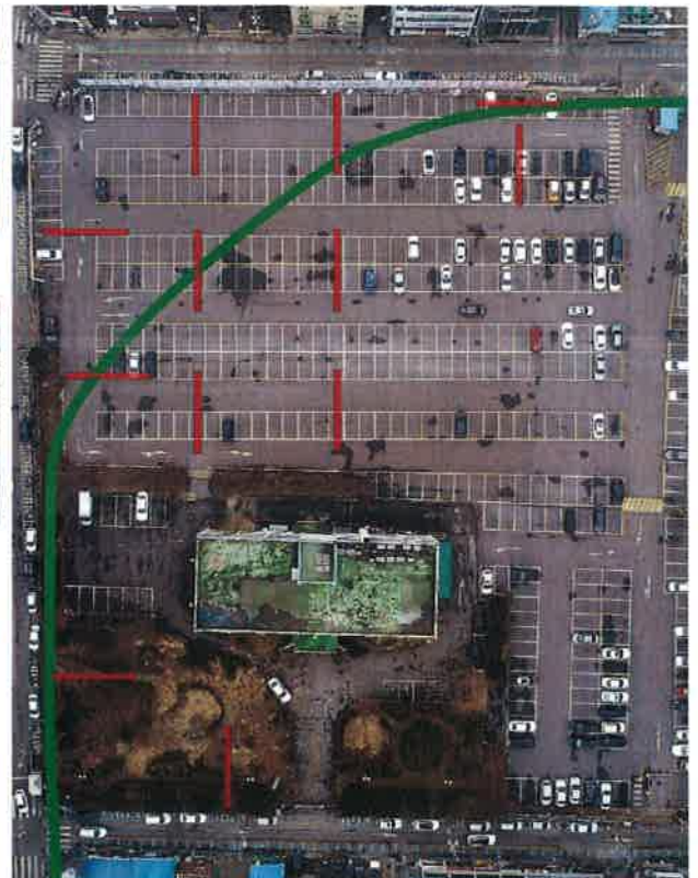
조사지역 및 트렌치 배치도