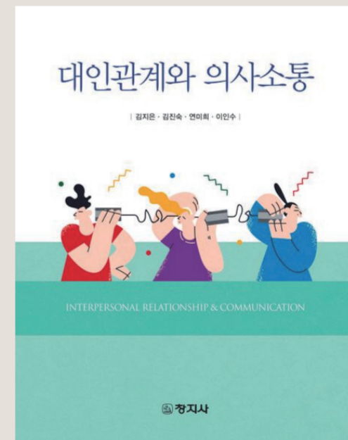
「대인관계와 의사소통」 이인수 외