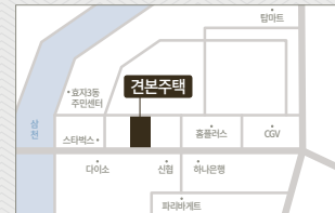
건본주택 | 전주시 완산구 효자동1가 411-1번지