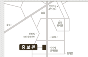
홍보관 | 전주시 완산구 모악로 4665번지 2층 평화동 현대자동차 매장 건물