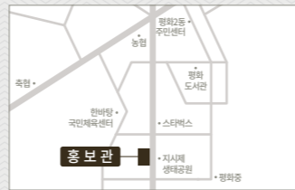
홍보관 | 전주시 완산구 모악로 4665번지 2층 평화동 현대자동차 매장 건물