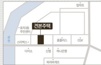
건본주택 | 전주시 완산구 효자동1가 411-1번지