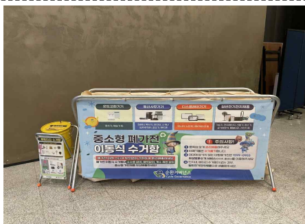
(4구 수거함 + 폐배터리 수거함)