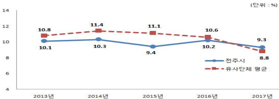
지방보조금 비율 유사 지방자치단체와 비교