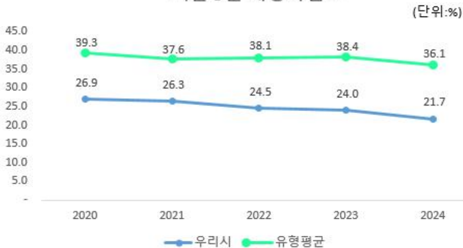
최근 5년 재정자립도

우리시의 재정자립도는 최근 감소 추세이고 동일 지자체 유형평균에 비해서는 낮은 편입니다.